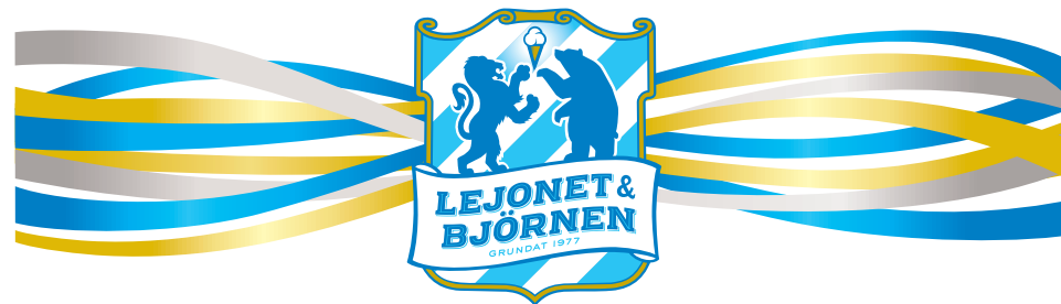
LOGOTYP MED KORT BAND